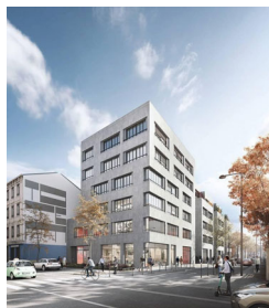
Immeuble Totem à Villeurbanne

Cofinance a signé, en précommercialisation, un bail commercial avec la Mutuelle générale de l'Éducation nationale (MGEN), portant sur une surface totale de plus 2 000 m 2 au sein de l'immeuble Totem, situé à l'angle du Cours Tolstoï et de la rue Pascal, à Villeurbanne.