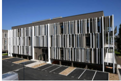
Ensemble de bureaux de 5 680 m 2 situé dans la commune de Bruges.

Cofinance a acquis en Vefa un ensemble de bureaux de 5 680 m 2 situé au 6 Rue Pierre et Marie Curie dans la commune de Bruges, près de Bordeaux, auprès d'Altae. Nommé « Evolution », ce programme tertiaire est en grande partie commercialisé auprès de deux locataires.